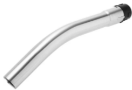
Edelstahl- Handrohr gebogen