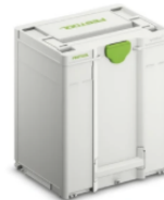
Systainer 3 SYS3 M 437