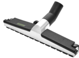
Bodendüse D 36 BD 370